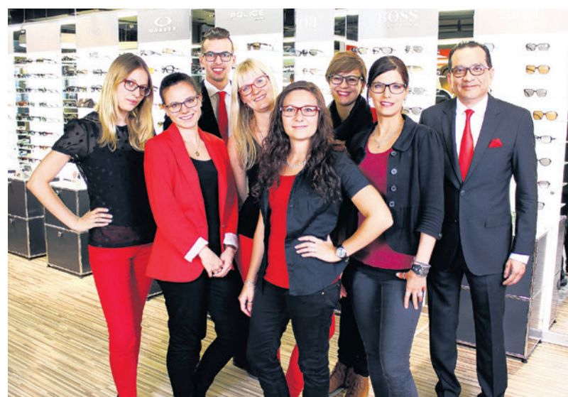
Das Import-Optik-Team in Sissach feiert am Samstag sein 15-Jahr-Jubiläum und lädt zum Jubiläumsfest ein.

Wie stehen Sie zu Kontaktlinsen? Gerne offeriert Ihnen Import Optik das kostenlose Probetragen von Kontaktlinsen. Heute können na-